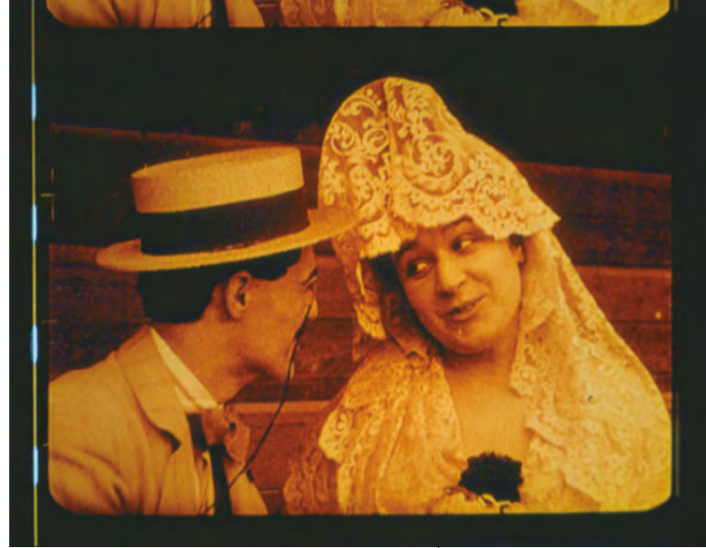
Sangre y arena (V. Blasco Ibáñez i Max André, 1916) Restaurada en 1996