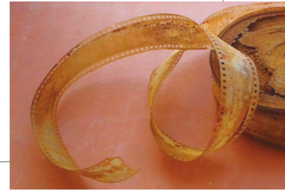
Pel·lícula de nitrocel·lulosa en descomposició