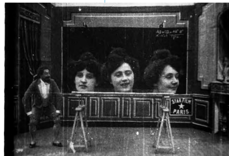
El huevo mágico (G. Méliès, 1902) Restaurada en 1993

Se puede plantear la cuestión al contrario: ¿qué razón convincente se puede esgrimir para propiciar y tolerar la destrucción de la memoria audiovisual? Una memoria formada tanto por imágenes documentales como por historias de ficción; tanto por películas de largo y corto metraje en soportes «profesionales» de 35 y 16 mm, como por filmaciones que reflejan la vida cotidiana en soportes amateur de 8, Super 8 y 9.5 mm. No sólo los investigadores y estudiosos del cine podrán basar sus trabajos en el visionado de estas imágenes; las futuras generaciones de ciudadanos podrán, gracias a este trabajo de preservación, apreciar los cambios en la fisonomía de los lugares que retratan, convirtiéndose en testimonios vivos del devenir de la geografía y la sociedad valencianas, urbana y rural.